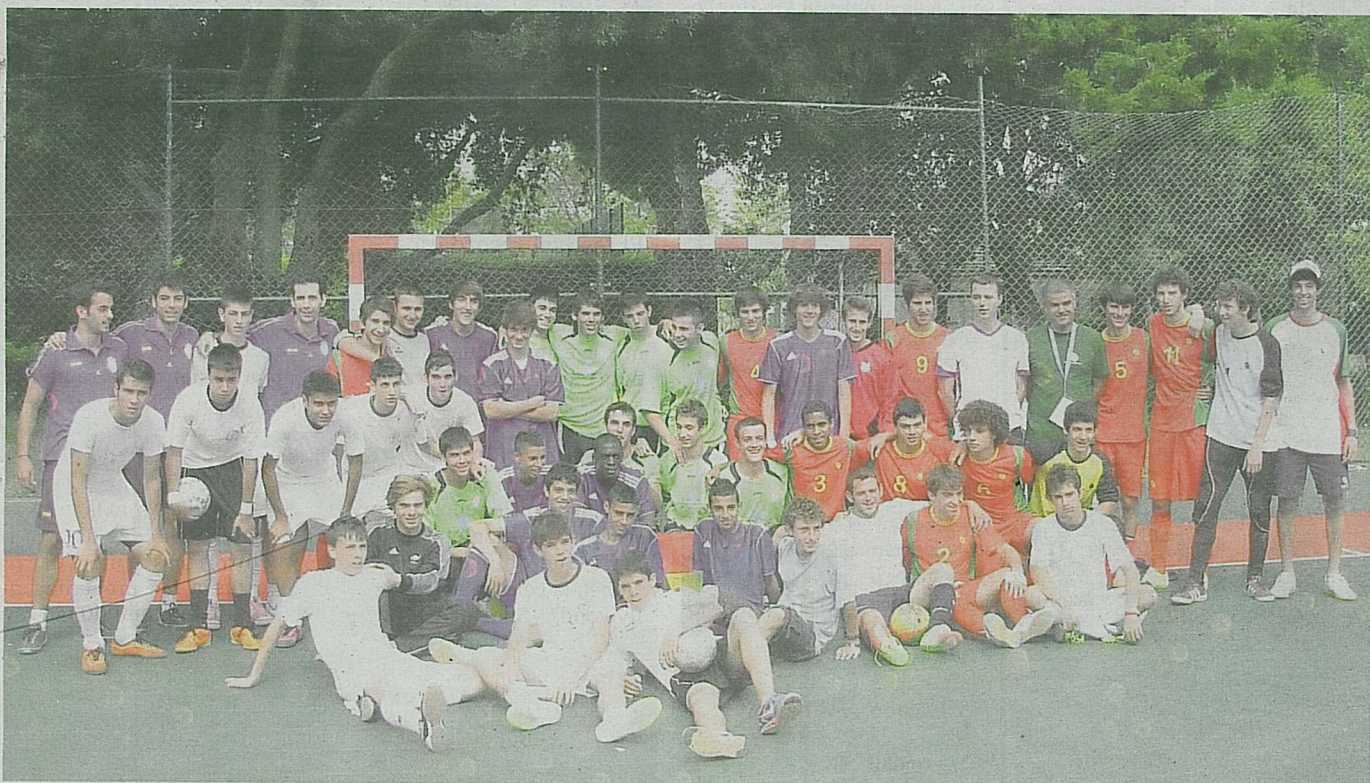
La convivencia en los Juegos FISEC de Lisboa fue la mejor experiencia para los deportistas