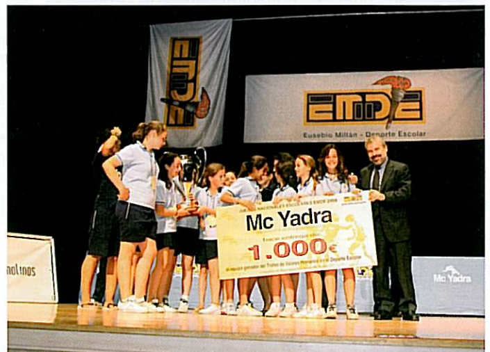
Las niñas del equipo Esclavas de Sevilla de baloncesto alevín recogen su cheque de McYadra por haber ganado el Trofeo Valores Humanos

Esta competición ha puesto de manifiesto, una vez más, que los Juegos Nacionales EMDE, que reúnen a deportistas de colegios católicos, tienen como objetivo fundamental formar a personas en los valores del Evangelio conscientes de que la práctica deportiva ayuda a entender que se puede ser creyente comprometido con nuestro mundo, con nuestra sociedad, deportista solidario que sabe trabajar en equipo y respeta a los jugadores de los equipos contrarios valorando sus cualidades, se gane o se pierda.