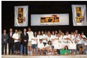
EMDE representa en el ámbito escolar español a más de 1.400.000 alumnos